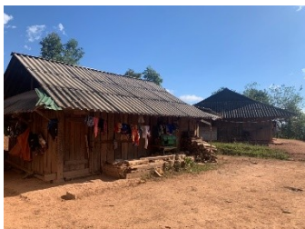
Woning in Na Co Sa

Er zijn afgelopen maanden twee projectvoorstellen ontvangen die met steun van Lien Doi gerealiseerd gaan worden.