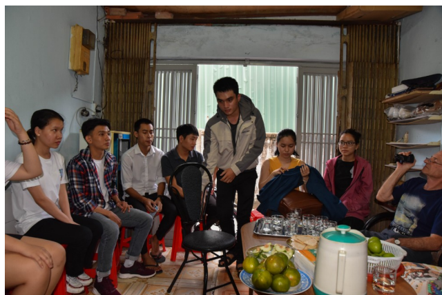
Studenten in Ho Chi Minh stad die een studiebeurs verkrijgen van Lien Doi

De voorgestelde deelnemers komen allemaal uit dezelfde regio. Dat is eenvoudiger te managen dan wanneer studenten verspreid over het land wonen. Het is net als bij ons scholierenfonds de bedoeling dat behalve de studenten zelf, ook hun families betrokken zijn en medeverantwoordelijk worden voor een goed verloop van het project. Het project vraagt vermoedelijk 2 jaar lang € 5.000,- van ons. Het is de bedoeling dat het zich daarna zelf kan bedruipen en in stand kan houden door aflossingen.