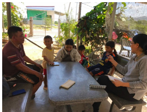
Intakegesprek voor nieuw sponsorkind

Sinds enkele jaren hebben we de koppeling van een donateur aan een specifiek kind losgelaten, omdat het soms wat geforceerd aanvoelde, vooral in coronatijd werd het ook lastig uitvoerbaar voor onze mensen in Vietnam. Individuele pleegouders zijn nu sponsors van het scholierenfonds (overigens kunt u nog steeds gekoppeld worden aan een specifiek kind als u dat fijn vindt) Met uw bijdragen kunnen we jaarlijks voor vijftig kinderen schoolgeld en schoolspullen bekostigen.