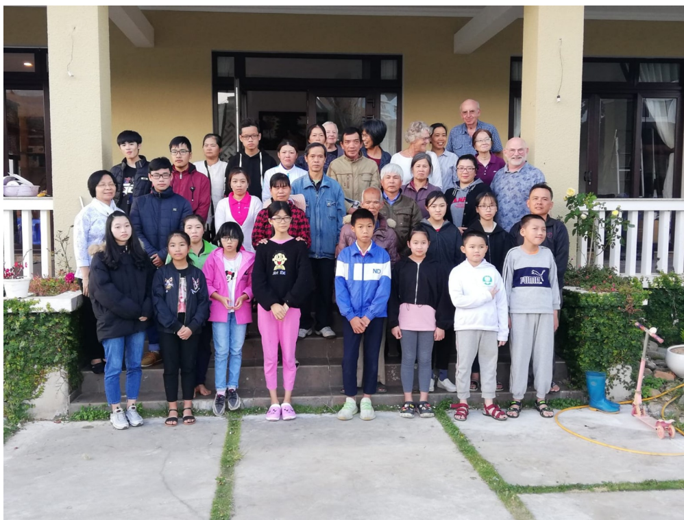
Steun zodat armste mensen in Vietnam kunnen helpen.

Alle donateurs die de schoolgang van kinderen steunen worden hierover komende weken geïnformeerd via een brief.