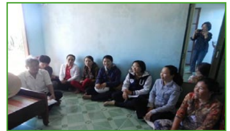
Scholing voor de kredietverlening