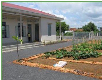
de kostschool in Ea Yieng in Dak Lak.

eveneens 2010: Riolering en verbetering van de weggetjes in Buonmathuot ook in Dak Lak en een project uit 2012: een boot voor scholieren in Quy Mong in Tran Yet.