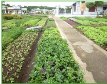
riolering en verbetering van weggetjes in Quy Mong