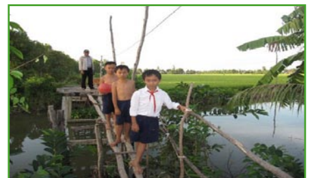
Een nieuwe verharde weg en brug is een droom voor deze mensen.